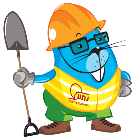
קשה עכשיו הקלה אחר כך